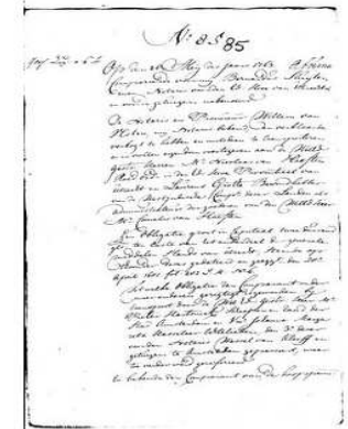
Figuur 5 originele Notariële Akte

De heren kopen op deze manier in 1754 27 obligaties, hun topjaar; in 1770 schaffen zij zo tien obligaties aan en in 1776 verwerven ze vijf obligaties. In de overige jaren kopen ze niet zo veel stuks, soms slaan ze zelfs een jaar over. Gemiddeld kost een obligatie hen bijna fl. 1000.